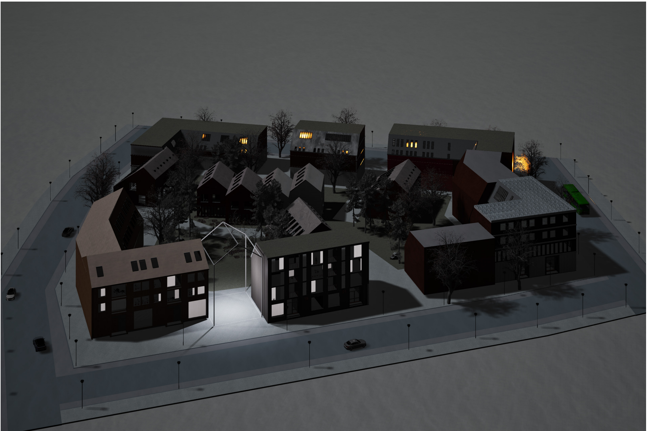
I denna grundform, konstverkets noll läge, så fungerar verket också som ett slags (kulturellt) fyrtorn.